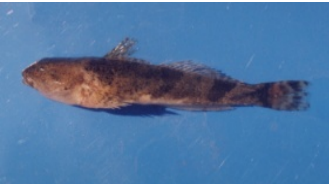
ウツセミカジカ(ぼっか)

腹鰭は胸鰭のほぼ真下、尾びれは二又 腹鰭は吸盤状ではない。 どんこに似るが口は小さい