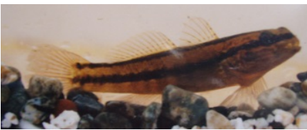
シモフリシマハゼ(ごれんちゃ)