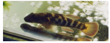
トウヨシノボリ(めごず)

腹鰭は胸鰭のほぼ真下で吸盤状 尾鰭の先は丸い 口は大きい。背鰭付け根に黒い点 すみうきごりの背鰭には黒点はない