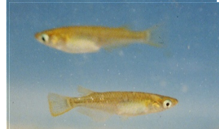
みなみめだか(めんぱ、ねんぱ)

腹鰭は胸鰭より後方、尾鰭は二又 背鰭は短く、口ひげはない。 体に横縞、各鰭は白っぽい