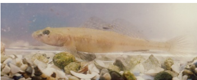
シンジコハゼ(めごず)

腹鰭は胸鰭のほぼ真下で吸盤状 尾鰭の先は丸い 口は小さい。背鰭付け根に黒い点 よく見ると、色素が薄い縦長斑紋がある 産卵期の雌はこの斑紋が黄色くなる