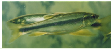
かわむつ (はえ、あかばえ)

腹鰭は胸鰭のほぼ真下で吸盤状 尾鰭の先は丸い 口は小さい。背鰭付け根に黒い点 よく見ると、色素が薄い縦長斑紋がある 産卵期の雌はこの斑紋が黄色くなる