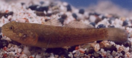
ヌマチチブ(ごれんちゃ)

腹鰭は胸鰭のほぼ真下で吸盤状 尾鰭の先は丸い 第一背鰭に黒点はない。 体の後半部は細い縦じま