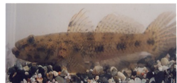
ウロハゼ(あなごず)

腹鰭は胸鰭のほぼ真下、尾びれは二又 腹鰭は吸盤状ではない。 かじかに似るが口は大きい