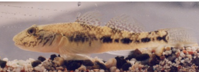
ゴクラクハゼ(めごず)

腹鰭は胸鰭のほぼ真下で吸盤状 尾鰭の先は丸い 第一背鰭に黒点はない。 体の後半部は細い縦じま