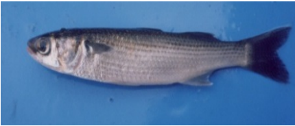
ボラ(当才魚 ないす)

腹鰭は胸鰭よりやや後方、尾鰭は二又 胸鰭の付け根が青い。 青くないのはセスジボラなど