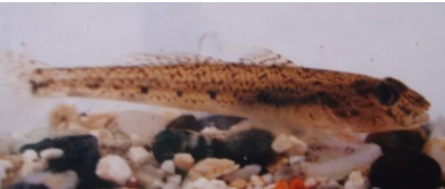
アシシロハゼ(めごず)

腹鰭は胸鰭のほぼ真下、尾びれは二又 腹鰭は吸盤状ではない。 どんこに似るが口は小さい